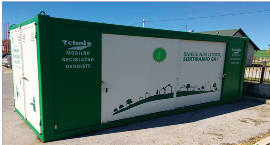
Slika 3: Mobilno reciklažno dvorište

Sukladno Zakonu o održivom gospodarenju otpadom (NN 94/13) i Uredbi o gospodarenju komunalnim otpadom (NN 50/17) Jedinica lokalne samouprave dužna je u naseljima u kojima se ne nalazi reciklažno dvorište osigurati funkcioniranje istog posredstvom mobilne jedinice.