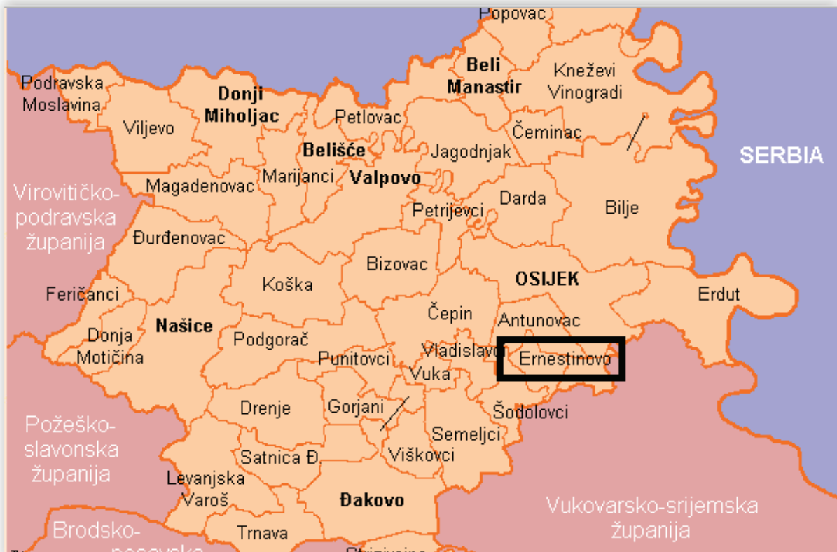
Slika 1: Administrativne granice Općine Ernestinovo unutar Osječko-baranjske županije ( www.mup.hr )

Općina Ernestinovo je dio šireg prostora istočnog dijela Republike Hrvatske, a administrativno je dio prostora Osječko-baranjske županije. Općina je smještena u jugoistočnom dijelu Županije, s udjelom 0,78 % županijskog prostora. Općina Ernestinovo je u okruženju općine Antunovac na sjeveru, općine Šodolovci na zapadu istoku (s obzirom na prostor Općine kojeg čine dva odvojena dijela između kojih je prostor Općine Ernestinovo), te prostorom Vukovarsko-srijemske županije na jugu, odnosno općinama Markušica i malim dijelom općine Tordinci. Općina ukupno zauzima površinu od 32,24 km 2 . Stanovništvo Općine živi raspoređeno u tri naselja: Divošu, Ernestinovu i Laslovu, pri čemu je naselje Ernestinovo Općinsko središte.