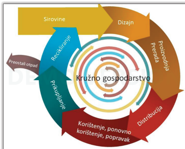
Slika 5: Model kružnog gospodarstva (Izvor: Plan gospodarenja otpadom RH 2017.-2022.godine)

Jedan od osnovnih ciljeva Europske Unije je potaknuti unaprjeđenje gospodarskog sustava u smislu učinkovitijeg korištenja resursa i energije. Središnji aspekt ove strategije je prelazak s postojećeg, linearnog, na kružno gospodarstvo, ekonomski model koji osigurava održivo gospodarenje resursima i produžavanje životnog vijeka materijala i proizvoda. Cilj ovog modela je svesti nastajanje otpada na najmanju moguću mjeru, i to ne samo otpada koji nastaje u proizvodnim procesima, već sustavno, tijekom čitavog životnog ciklusa proizvoda i njegovih komponenti.