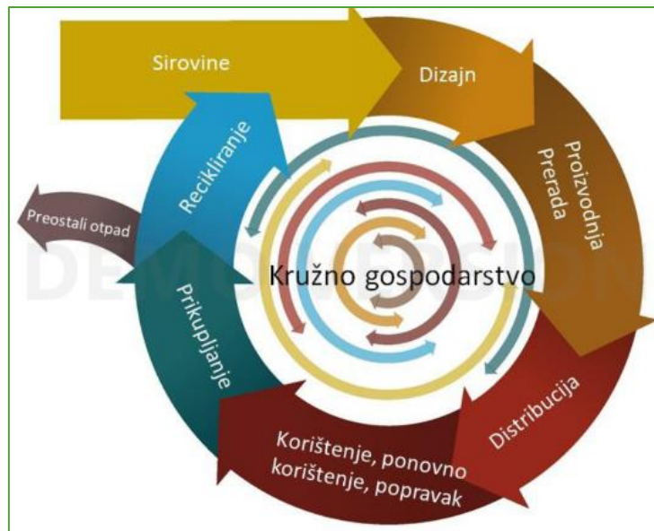
Slika 5: Model kružnog gospodarstva (Izvor: Plan gospodarenja otpadom RH 2017.-2022.godine)

je svesti nastajanje otpada na najmanju moguću mjeru, i to ne samo otpada koji nastaje u proizvodnim procesima, već sustavno, tijekom čitavog životnog ciklusa proizvoda i njegovih komponenti.