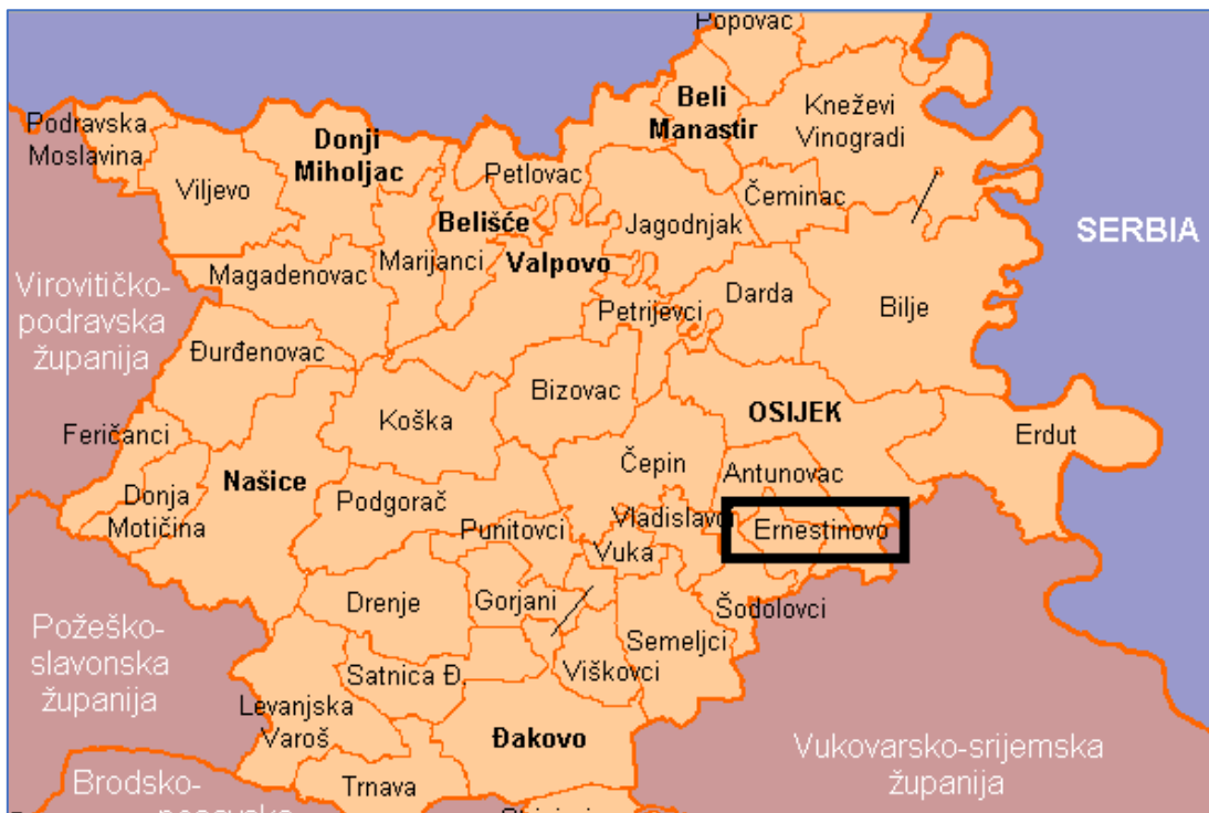
Slika 1: Administrativne granice Općine Ernestinovo unutar Osječko-baranjske županije ( www.mup.hr )

Općina Ernestinovo je dio šireg prostora istočnog dijela Republike Hrvatske, a administrativno je dio prostora Osječko-baranjske županije. Općina je smještena u jugoistočnom dijelu Županije, s udjelom 0,78 % županijskog prostora. Općina Ernestinovo je u okruženju općine Antunovac na sjeveru, općine Šodolovci na zapadu istoku (s obzirom na prostor Općine kojeg čine dva odvojena dijela između kojih je prostor Općine Ernestinovo), te prostorom Vukovarsko-srijemske županije na jugu, odnosno općinama Markušica i malim dijelom općine Tordinci. Općina ukupno zauzima površinu od 32,24 km 2 . Stanovništvo Općine živi raspoređeno u tri naselja: Divošu, Ernestinovu i Laslovu, pri čemu je naselje Ernestinovo Općinsko središte.