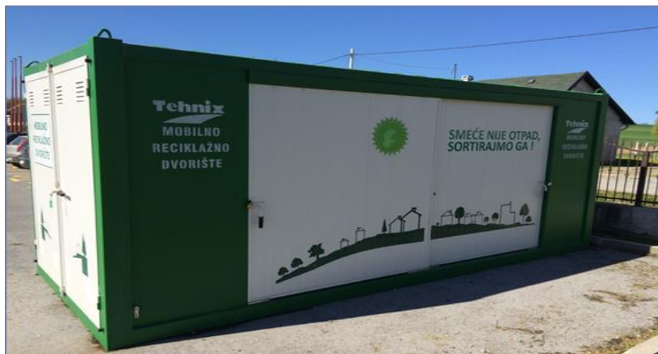
Slika 3: Mobilno reciklažno dvorište

Sukladno Zakonu o održivom gospodarenju otpadom (NN 94/13) i Uredbi o gospodarenju komunalnim otpadom (NN 50/17) Jedinica lokalne samouprave dužna je u naseljima u kojima se ne nalazi reciklažno dvorište osigurati funkcioniranje istog posredstvom mobilne jedinice.